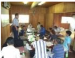
産地部会での集合研修