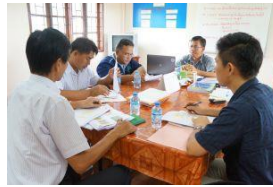
生産組織のQMS業務の 聞き取り調査と指導