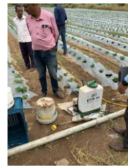
輸入商社の取引先産地 (インド)の管理状況調査 と指導