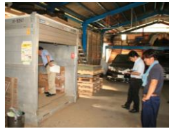
農場現場での評価と指導